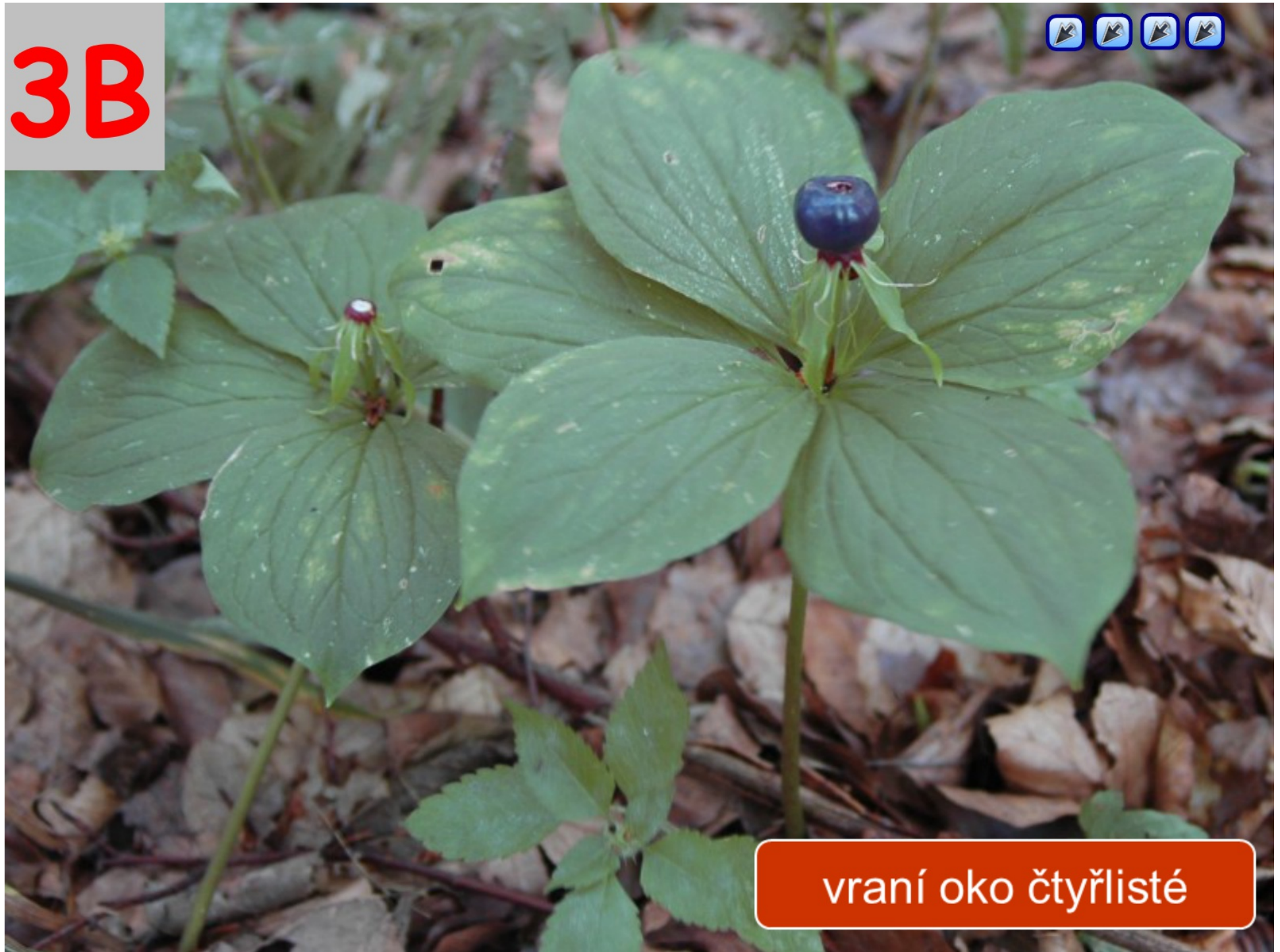
vraní oko čtyřlisté